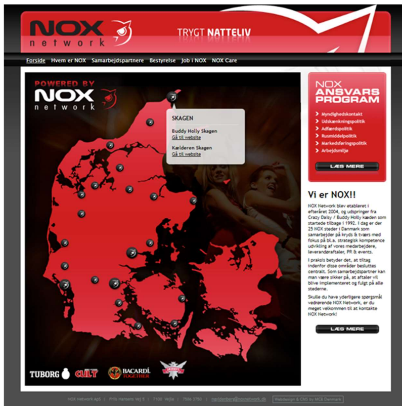
Figur 3.1 Kort over Diskotekernes geografiske placering

Note: Styrelsen bemærker, at der løbende har været udskiftning af medlemmerne i NOX, og at Diskotekernes placering derfor har været dynamisk i overtrædelsesperioden.