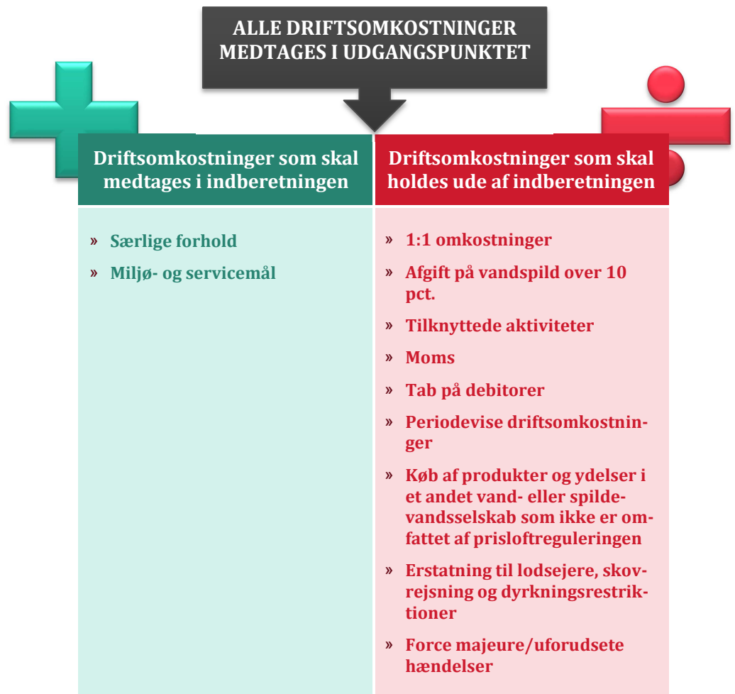
Figur 4.1 Driftsomkostninger

Disse overordnede driftsomkostningskategorier er yderligere specificeret i følgende underafsnit.