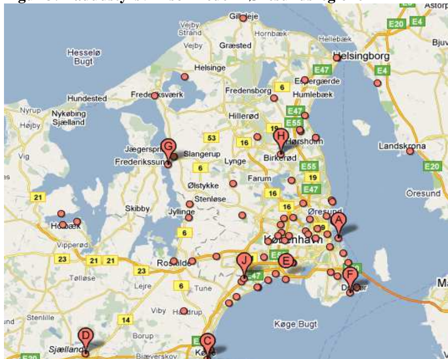
Figur 3: Bådudstysvirksomheder i Øresundsregionen

Punkter markeret med et bogstav er butikker, som sælger bådudstyr. De øvrige punkter er butikker, som sælger bådudstyr samt andre relaterede butikker.